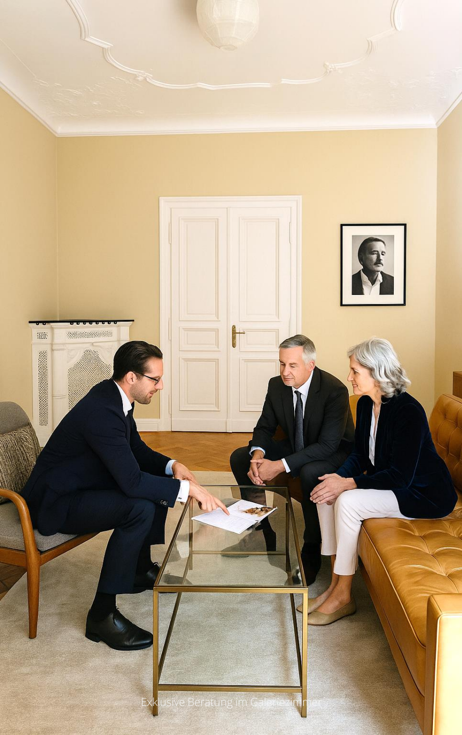
Exklusive Beratung im Galeriezimmer